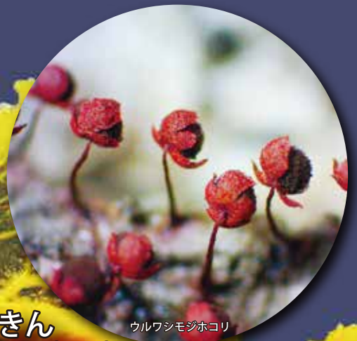
ウルワシモジホコリ