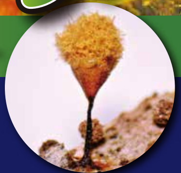
ホソエノヌカホコリ

本展では、粘菌の変形体（大きなアメーバ）や標本、熊楠の研究などを通して、不思議な生き物、粘菌を紹介します。