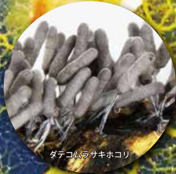
ダテコムラサキホコリ