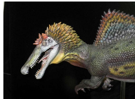
スピノサウルス類の生体復元模型