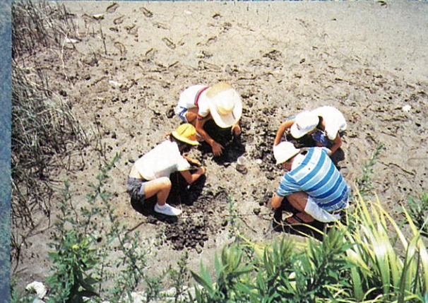
亀の川でのチゴガニの観察