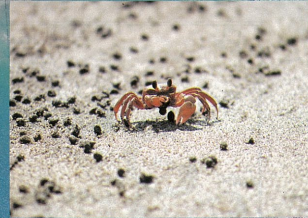
浜の宮のスナガニ