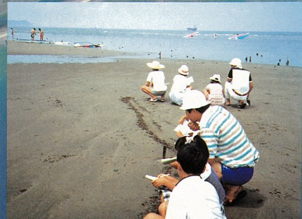
和歌川河口でのヨメツキガニの観察