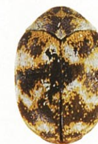
ヒメマルカツオブシムシ