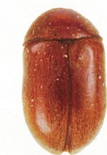
タバコシバンムシ