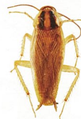
チャバネゴキブリ